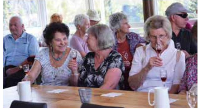
Schnapsverkostung am Mandlbergergut

benötigt werden. Anschließend erfuhren wir viel von der Kunst des Destillierens. Gutgelaunt nach einigen gekosteten Schnapsern ging es weiter zur Unterhofalm in Filzmoos. Hier genossen wir erst einmal ein gutes Mittagessen. Die hohen Temperaturen nahmen alle gerne in Kauf, zumal uns das herrliche Bergpanorama begeisterte. Sportlich umrundeten die meisten den idyllisch gelegenen Almsee, bevor es im klimatisierten Bus wieder nach Hause ging.